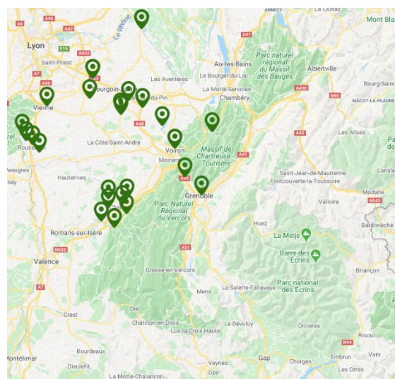
Carte : Nids confirmés de frelon asiatique sur le département de l'Isère en 2019

Les conditions climatiques de l'année semblent avoir été défavorables au prédateur. Malgré tout, le frelon asiatique continue sa progression.